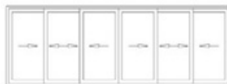
Corredera 6 Hojas