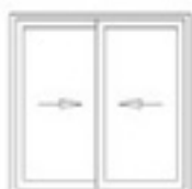
Corredera 2 Hojas