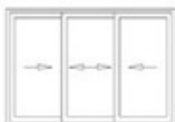
Corredera 3 Hojas