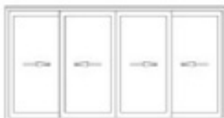
Corredera 4 Hojas